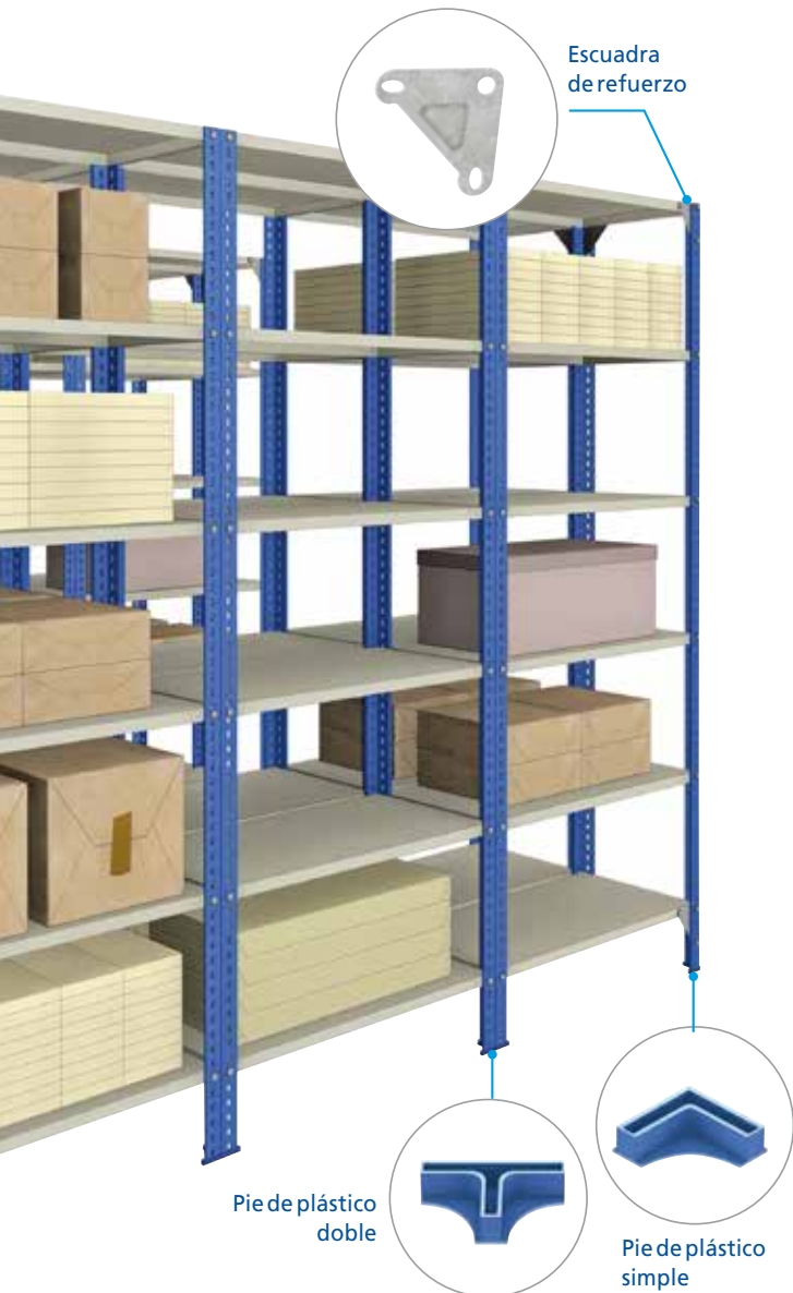
Pie de plástico doble