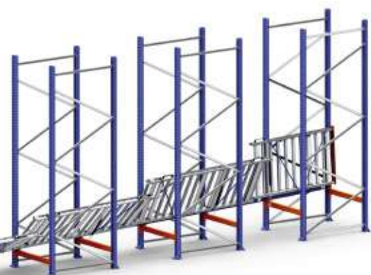
Cuatro de los canales son abatibles para posibilitar las labores de mantenimiento y limpieza

Los palets se agrupan en función de si corresponden a un pedido o ruta, quedando preparados para su posterior carga en los camiones de distribución, lo que minimiza los tiempos de espera.