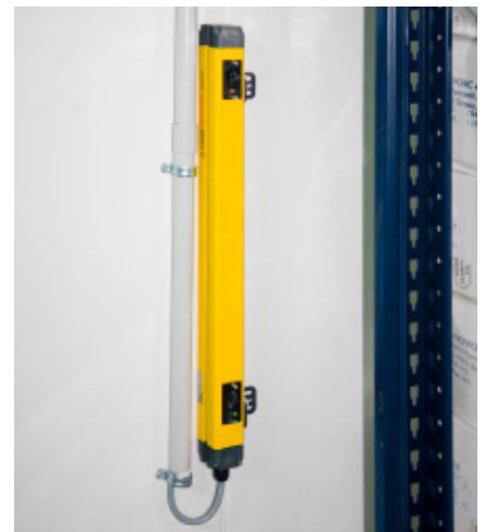
Barrera de seguridad exterior

Las estanterías Movirack son idóneas para las cámaras de congelación, ya que el consumo de energía por palet almacenado es más bajo gracias a la optimización del volumen de la cámara